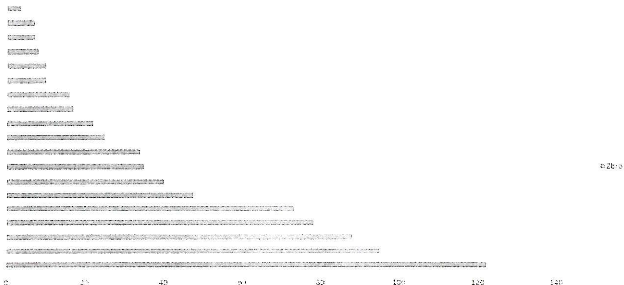
GRAF 3. Dežurstva u 2021.g. (sati/spašavatelju)